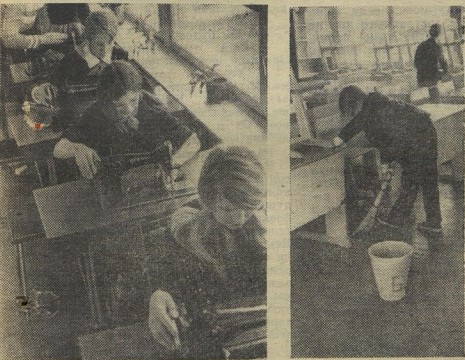
ПО ПЛЕДАМ НЕУПЛИВАННЫХ ПИСЕМ

Многие ребята села Чундига Алма-Атинской области увлекаются футболом, волейболом, легкой атлетикой. Раньше они проводили тренировки на стадионе. Но сейчас там проложена пешеходная дорожка, ворота на футбольном поле поломаны, нет-нет и машина проедет. Заниматься стало негде. Об этом нам написали юные спортсмены.